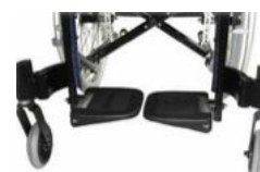
kit estabilizador : ESTÁNDAR con anchos de 208 hasta 280 mm